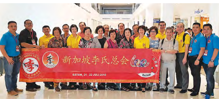
抵步时码头全体照

欢迎晚宴于八时开席，志远会长被邀上台唱一曲“我问天”。晚宴在一片欢笑声中进行，志远会长代表我会交换纪念品。