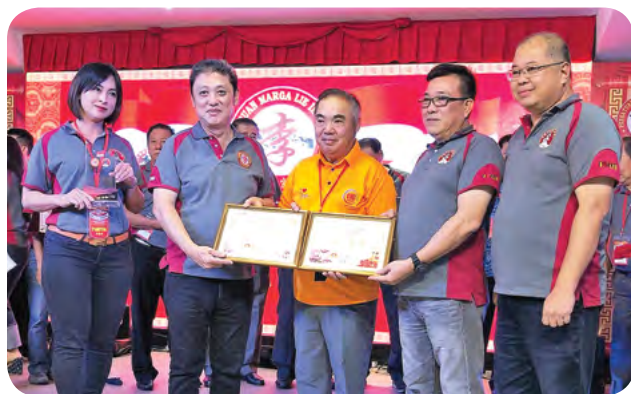
志远会长赠送纪念品予峇淡李氏宗亲会来贵会长(右二)和印尼李氏宗亲总会国强会长(左二)