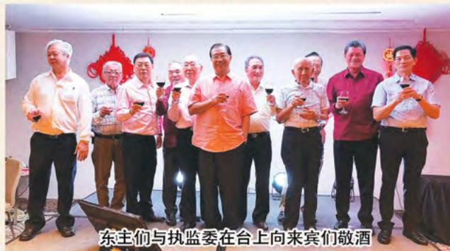
东主们与执监委在台上向来宾们敬酒