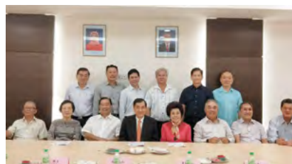
出席的执监委与振强理事长合照

振强理事长在交流会上,感谢我会执监委对世界李氏宗亲总会的支持与贡献。表扬了我会于2016年成功的举办《三禧庆典》,并对总会的活动给予肯定。振