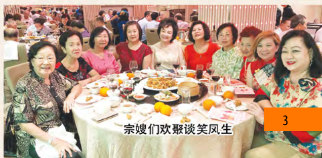
宗嫂们欢聚谈笑风生