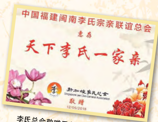
李氏总会敬赠于各宗亲会的纪念品