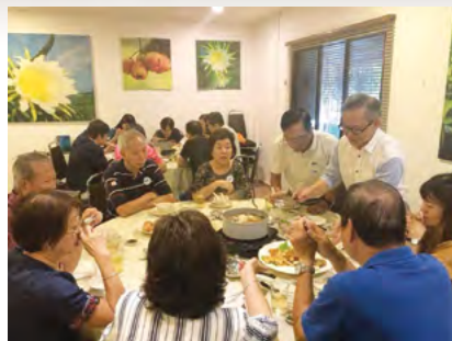
午餐时间大快朵颐