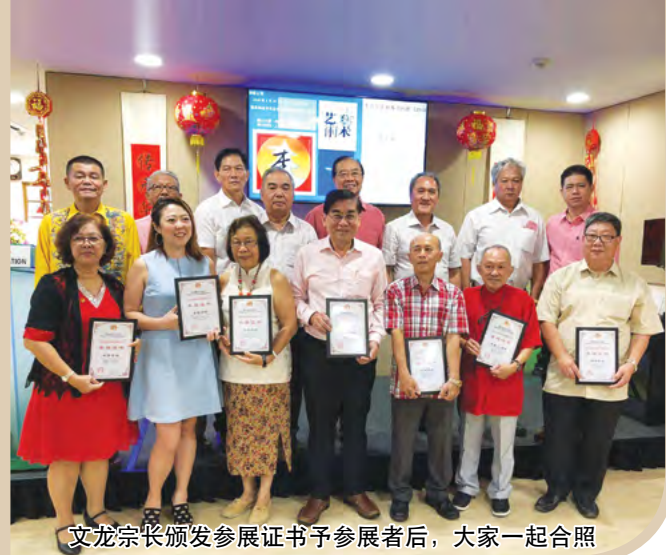
文龙宗长颁发参展证书予参展者后，大家一起合照