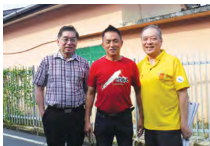
与国萍宗长合影留念