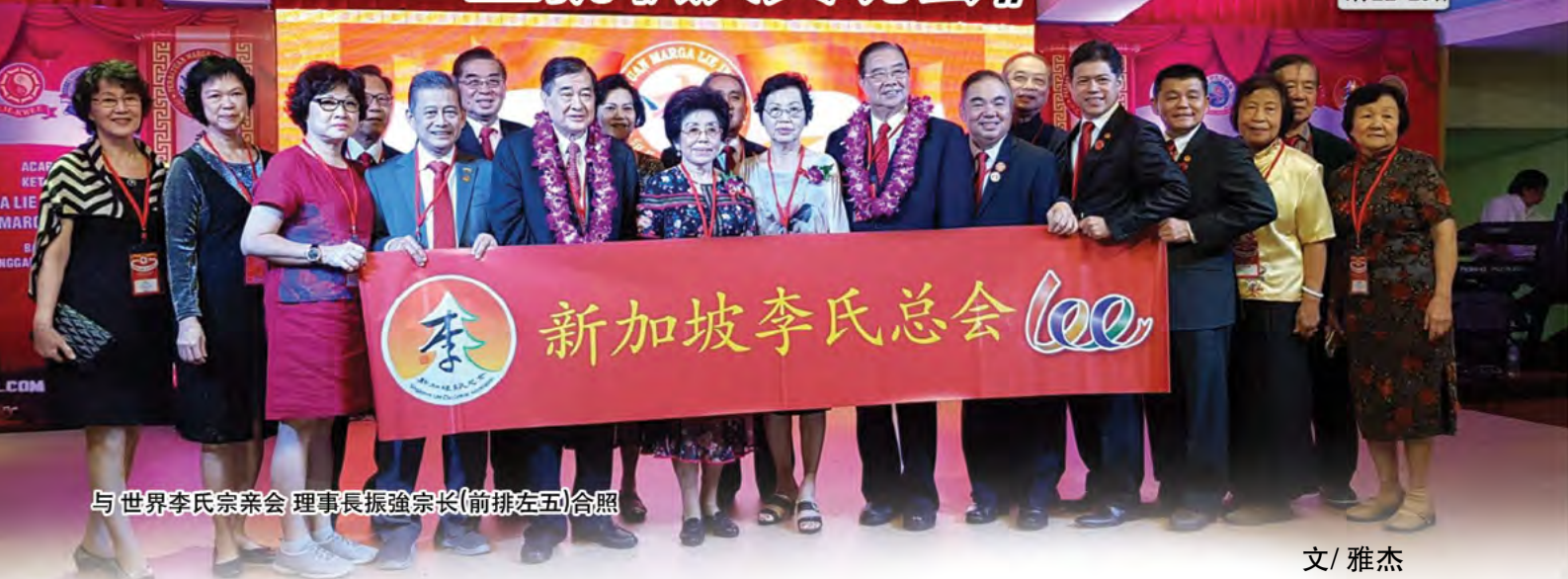
与世界李氏宗亲会 理事长振强宗长(前排左五)合照