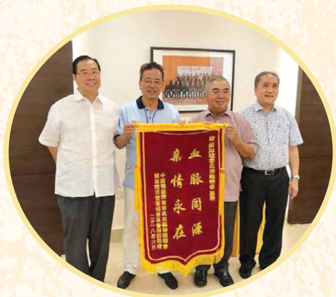
闽南李氏宗亲总会甲煦会长(左二) 赠送锦旗于本会，由本会志远会长代表接受