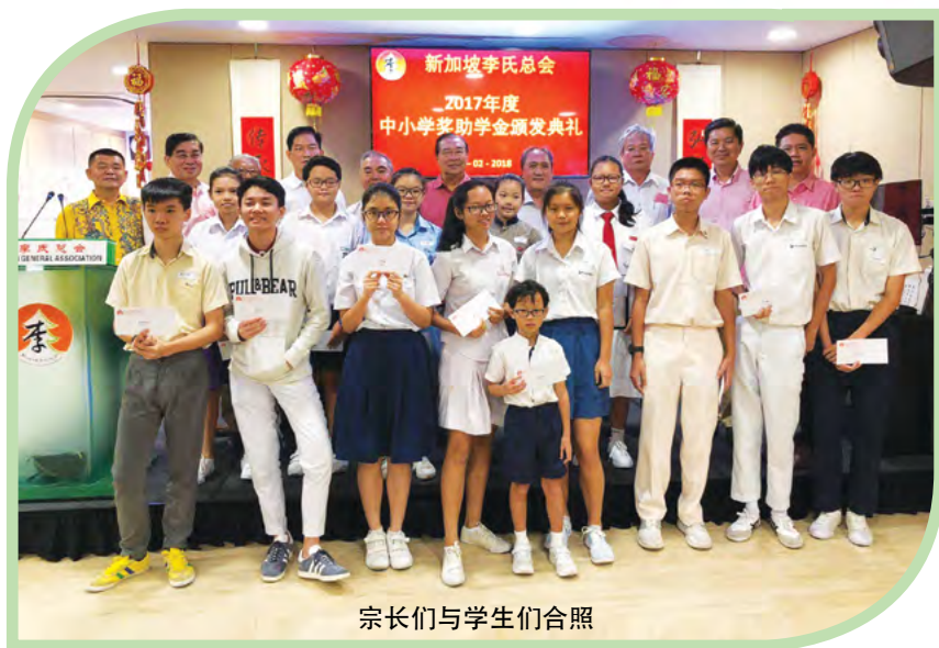
宗长们与学生们合照

志远会长感谢到场的宗亲并祝福大家新年快乐、财源广进、身体健康，同时介绍了总会的一些活动，并鼓励会员积极参与。然后，大家一起进行团拜，互相道贺，现场气氛热闹。