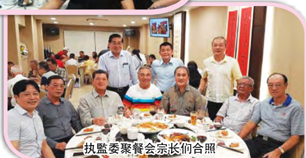
执监委聚餐会宗长们合照

从五月份开始，每个月的最后一个星期五，晚间七时至十时，定为执监委卡拉OK之夜，欢迎喜欢唱歌的执监委及亲友到来高歌一曲。不唱歌的宗亲及家人也可来凑热闹。