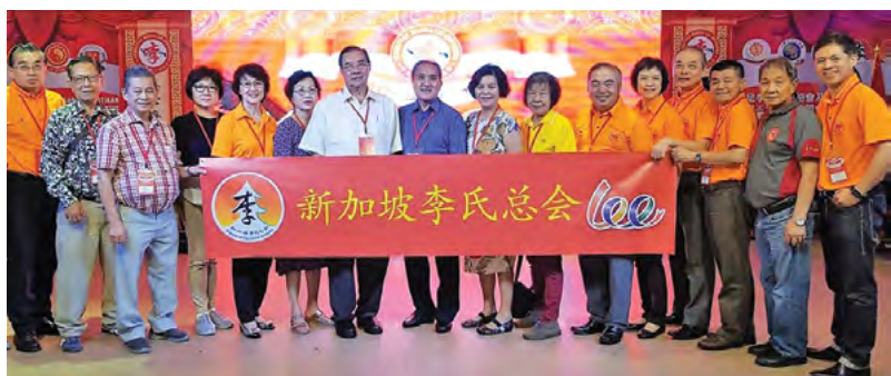
全体执监委与宗嫂欢迎晚宴合照