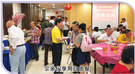
宗亲们享用自助餐