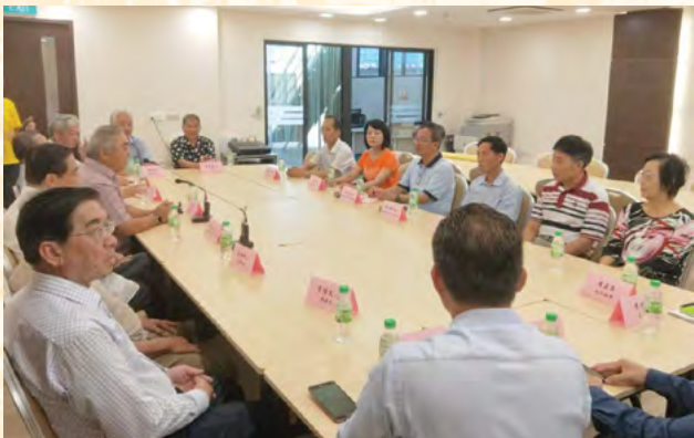
两地宗亲进行亲切的交流