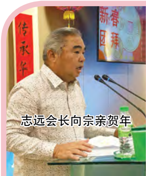
志远会长向宗亲贺年