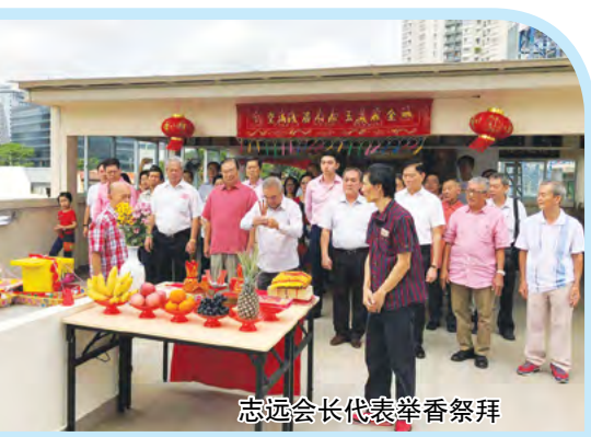
志远会长代表举香祭拜

2018年2月25日（农历正月初十），星期日上午十时，本会进行祭拜祖皇、新春团拜、颁发中小学奖助学金的活动和李氏宗亲新春书画展开幕的活动。