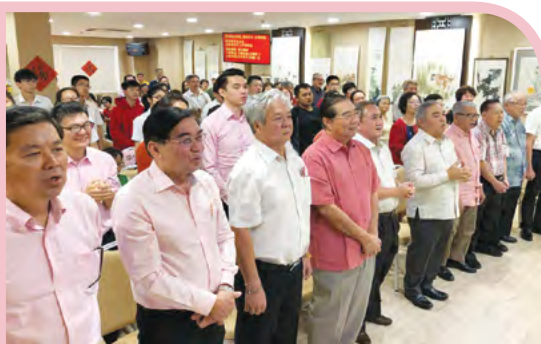
宗亲们起立互贺新春